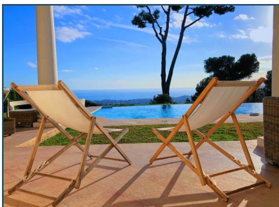
Coup de cœur